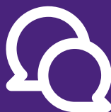
Karriärsamtal och intervjuträning